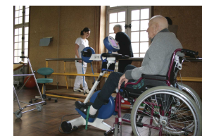
Plateau de rééducation

Unique en son genre, le CERAH a pour mission la recherche en matière de handicap moteur. Ses programmes concernent principalement le fauteuil roulant et l'analyse quantifiée de la marche des sujets appareillés. Centre de référence, ses prestations s'adressent à toutes les personnes handicapées.